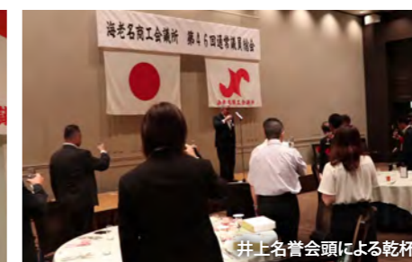
井上名誉会頭による乾杯