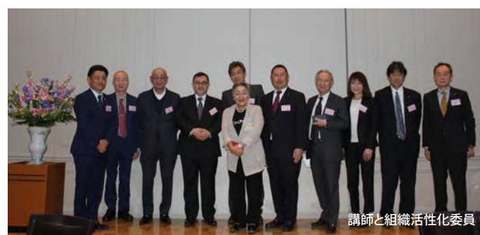
講師と組織活性化委員