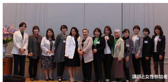
講師と女性参加者