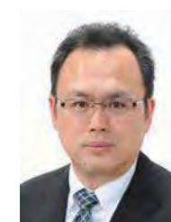
高野 栄一 高野写真光芸