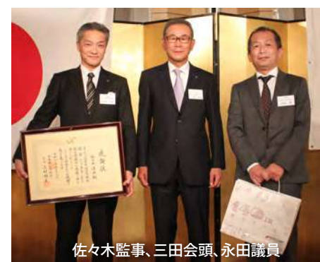
佐々木監事、三田会頭、永田議員