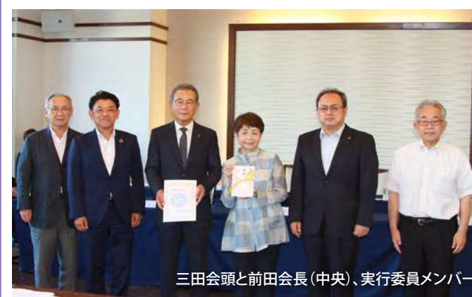
三田会頭と前田会長(中央)、実行委員メンバー

令和4年5月16日(月)本厚木カンツリークラブにおいて、会員相互の交流と親睦を目的として「第6回海老名商工会議所会員親睦チャリティゴルフ大会」を開催いたしました。今回も感染拡大防止の観点から表彰式、パーティーは行いませんでしたが、120名の方にご参加いただき盛会裏に終えることができました。