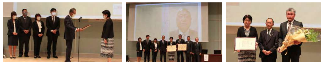
海老名商工会議所、日本商工会議所、海老名市より感謝状を追贈